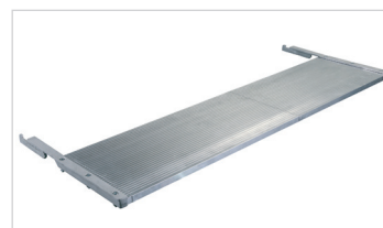
Piano laterale opzionale