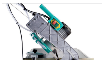
Taglio a 45°